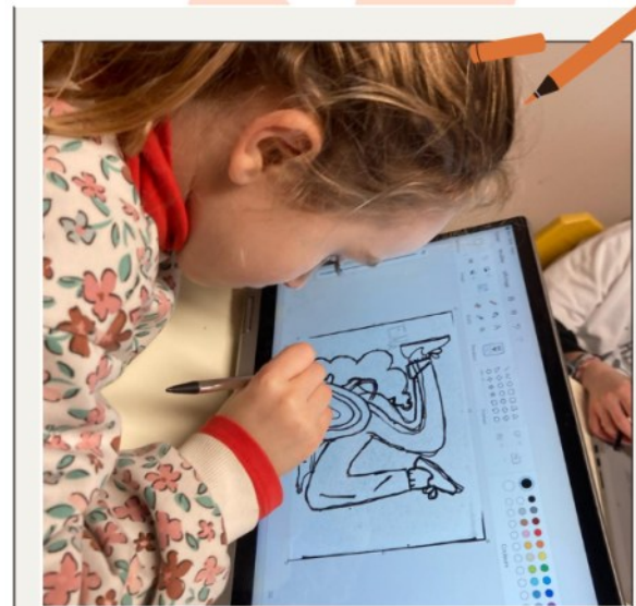
Décalquer sur tablette

"Nous avons décidé d'aller, un soir, à la piscine en minibus. Au fond de la piscine, il y a une grille ... En la soule-